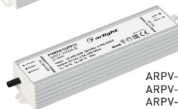
ARPV-12060-B ARPV-24060-B ARPV-12080-B ARPV-24080-B